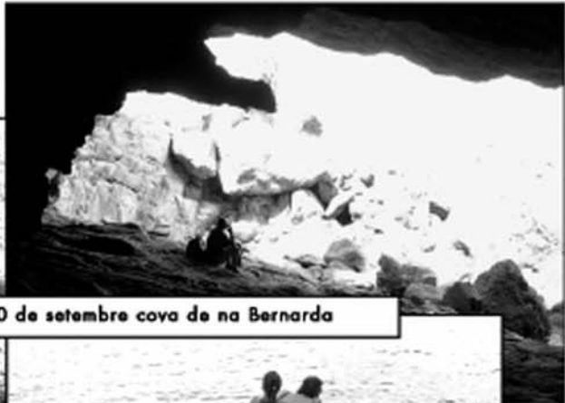
30 de setembre cova de na Bernarda