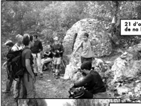
21 d'octubre puig de na Bauçana