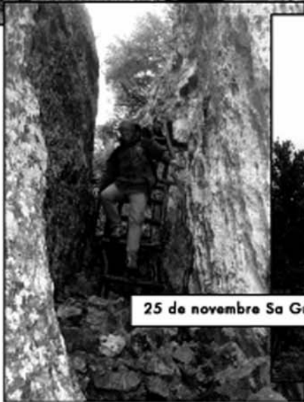
25 de novembre Sa Gúbla pas de Sa Fesa