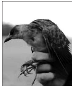
Gallet faver africà, observat i fotografiat a Porreres, en una bassa de la possessió des Pagos. L'au va ser capturada i anellada, essent la primera vegada que es registra a les Balears. Es tracta d'una raresa