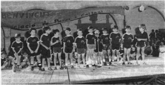
Una simpàtica actuació conjunta a la festa de fi de curs del Col·legi Verge de Monti-Sion.

El passat diumenge 12 de juny va tenir lloc a Monti-Sion la festa de la família organitzada pel Col·legi Verge de Monti-Sion, per a celebrar el fi de curs com a darrera activitat realitzada al llarg de l'any escolar 80-81.