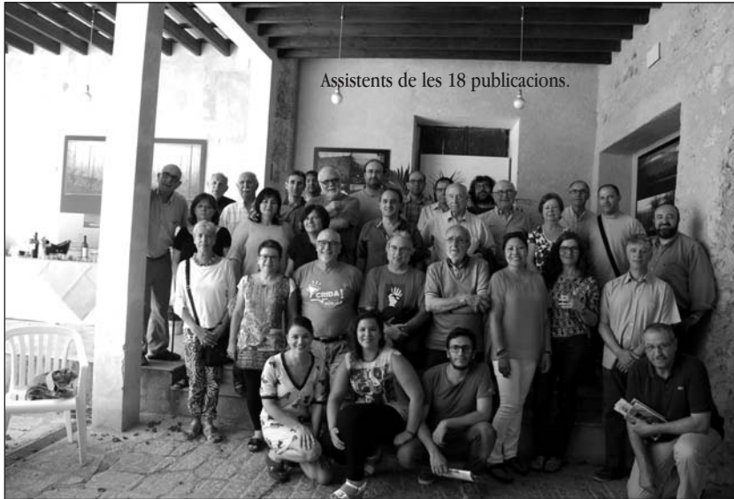
Assistents de les 18 publicacions.

El dissabte dia 6 de juny tingué lloc a Santa Maria la diada de Premsa Forana de Mallorca, amb l'assistència de 45 persones corresponents a 18 publicacions associades.