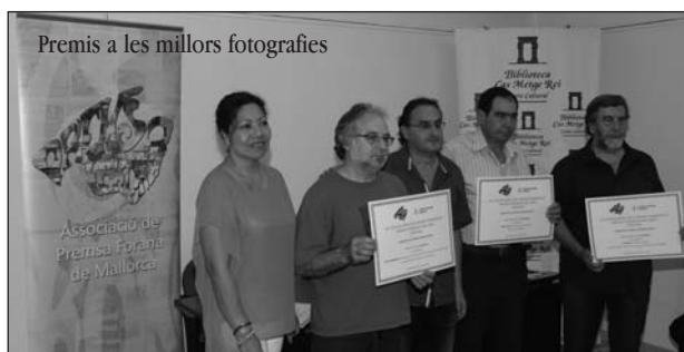
Premis a les millors fotografies