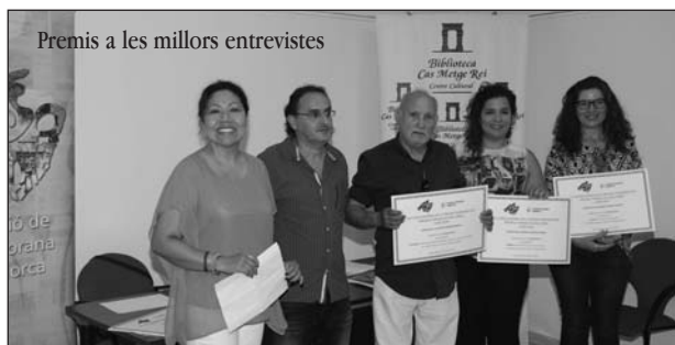
Premis a les millors entrevistes