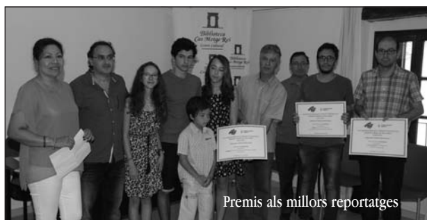
Premis als millors reportatges