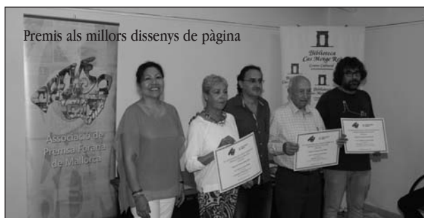
Premis als millors dissenys de pàgina