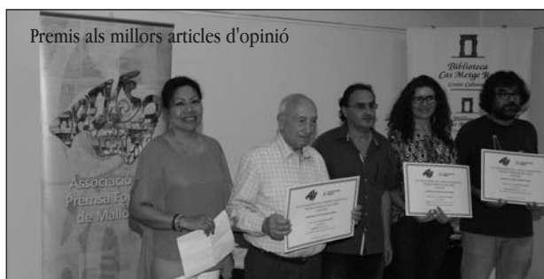
Premis als millors articles d'opinió