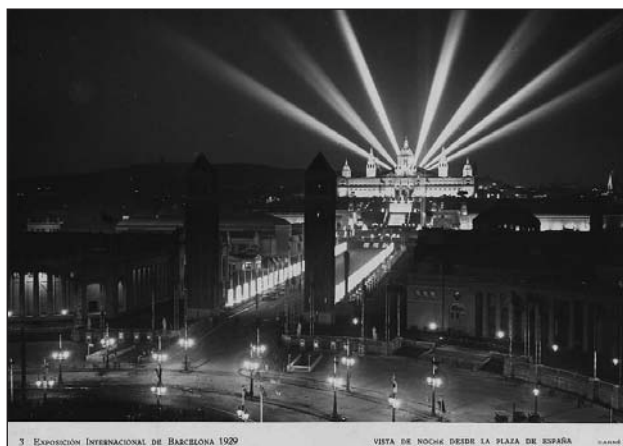
Expo 1929 Palau Nacional.

A Barcelona, a l'Institut Amatller d'Art Hispànic situat a la Casa Amatller (Passeig de Gràcia, 41) s'hi conserva l'Arxiu Mas, un enorme compendi de fotografies d'elements patrimonials de tot l'estat espanyol què és va començar a elaborar a principis de segle i encara ara resulta molt útil per als historiadors de l'art a l'hora de buscar imatges. En aquest article exposaré la raó de ser d'aquest arxiu que conté valuoses fotografies preses a Porreres.