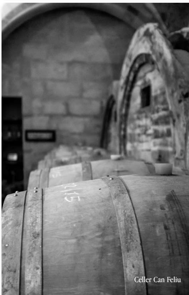
Celler Can Feliu