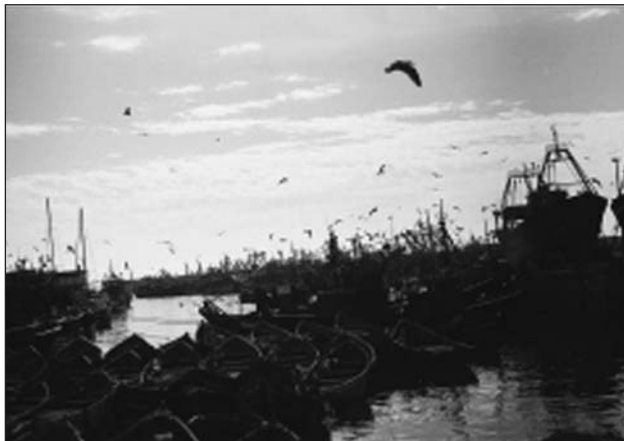
Port d'Essaouira, costa atlàntica

La zona del Marroc, tal i com la coneixem avui en dia,