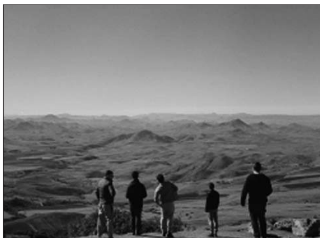
Azrou, Atlas Mitjà

Donada per acabada l'entrevista, queda obert l'espai a la reflexió. Però sense haver tractat de fons molts de temes és difícil poder arribar a cap conclusió. Personalment, el que m'ha fet pensar aquest treball és l'increïble desconeixement que tenim sobre els nostres veïnats, ja siguin amazics, txecs o escandinaus. No som uns pobles tan grans com perquè hi hagi aquests abismes entre nosaltres. És ridícul pensar que he compartit aula tota la meua infància amb amazics i fins avui no he après a dir ni 'bon dia'. En canvi, atesa la percepció vertical que tenim del món, sí que sabem coses del francès, tot i que no sigui una societat que a Vilafranca hi tengui molta tirada. Conèixer les diferents societats del Nord d'Àfrica és una eina clau per combatre la islamofòbia i d'altres prejudicis que s'estan estenent per Europa.