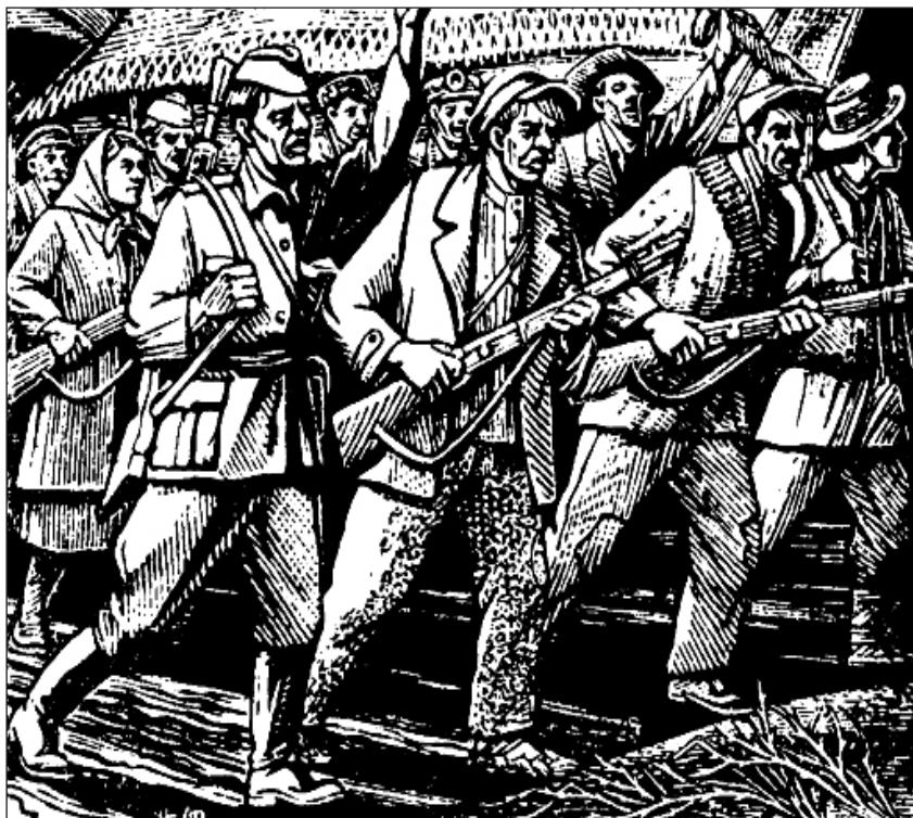
La primera Guerra Mundial (1914-1918) va afectar profundament l'economia mallorquina

A les ciutats espanyoles aquest malaurat problema no permetia albi-