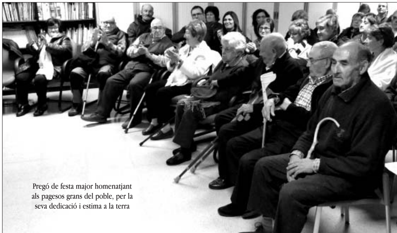
Pregó de festa major homenatjant als pagesos grans del poble, per la seva dedicació i estima a la terra