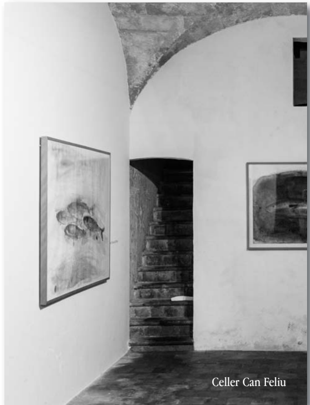
Celler Can Feliu