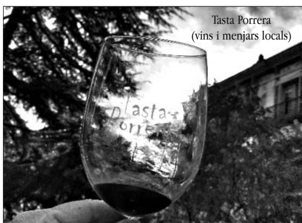
Tasta Porrera (vins i menjars locals)