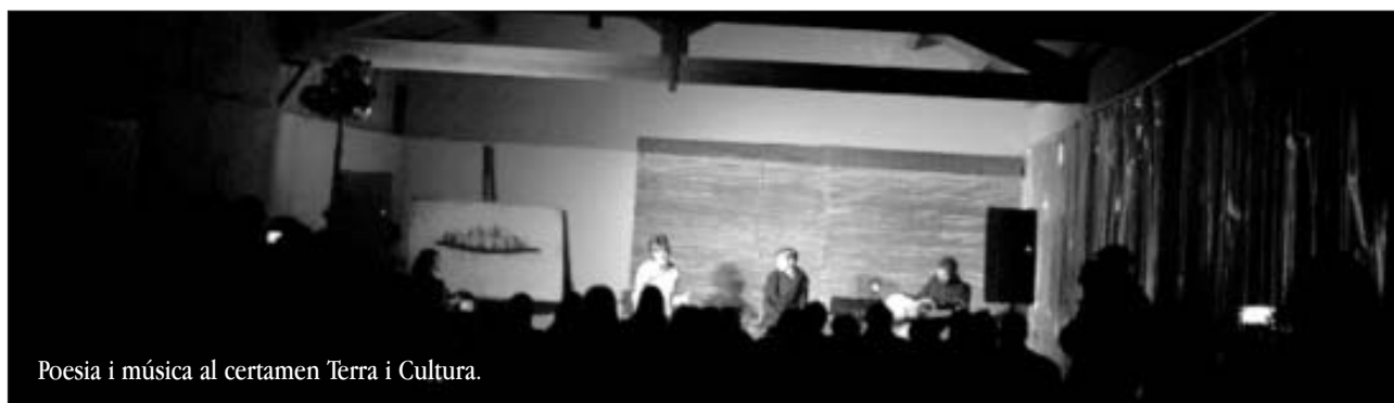
Poesia i música al certamen Terra i Cultura.