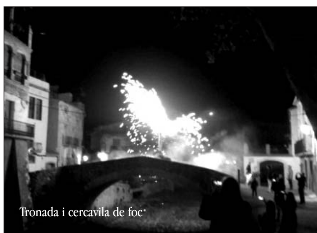
Tronada i cercavila de foc