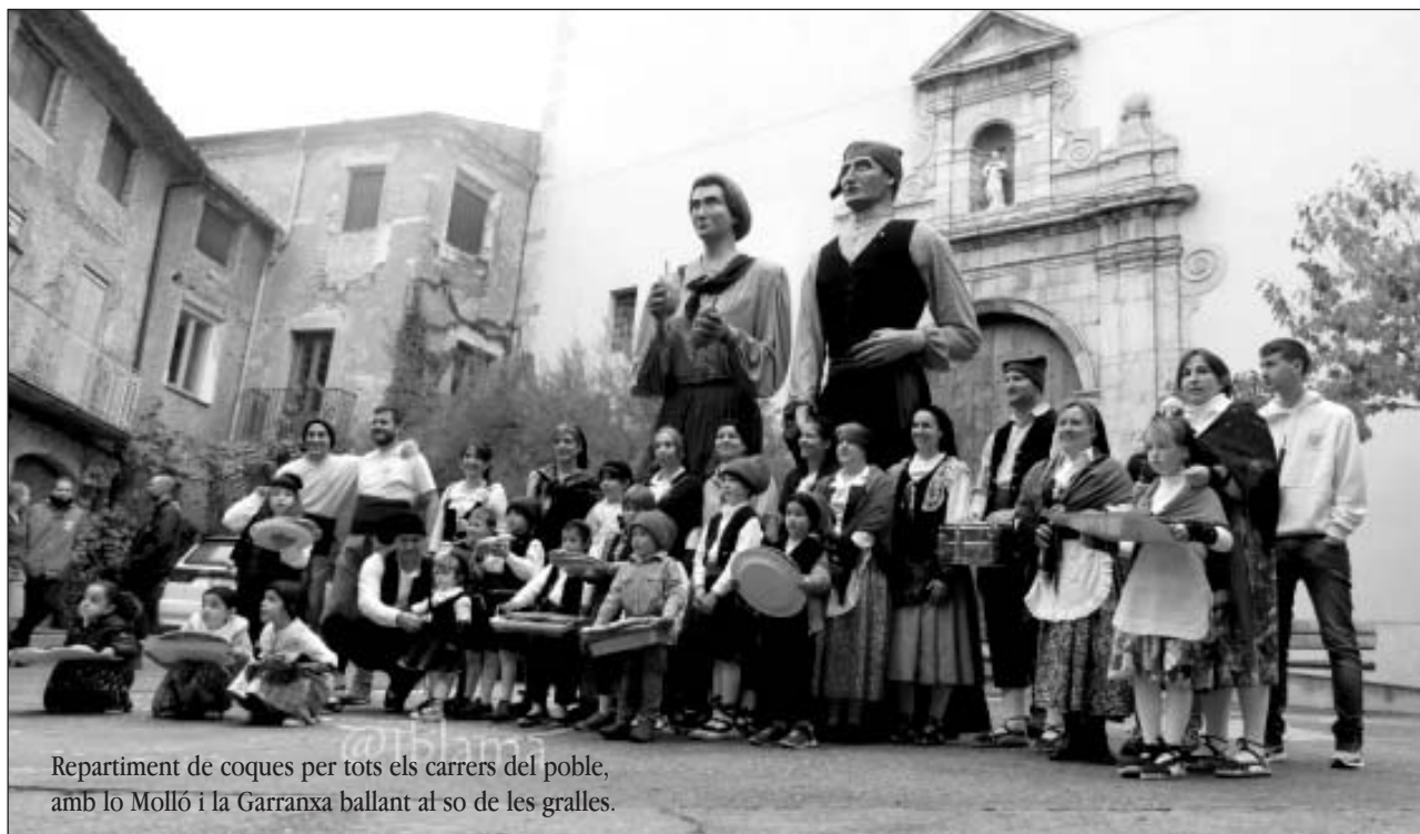
Repartiment de coques per tots els carrers del poble, amb lo Molló i la Garranxa ballant al so de les gralles.