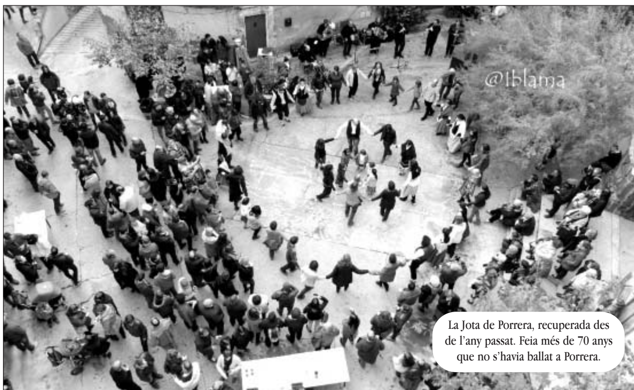
La Jota de Porrera, recuperada des de l'any passat. Feia més de 70 anys que no s'havia ballat a Porrera.