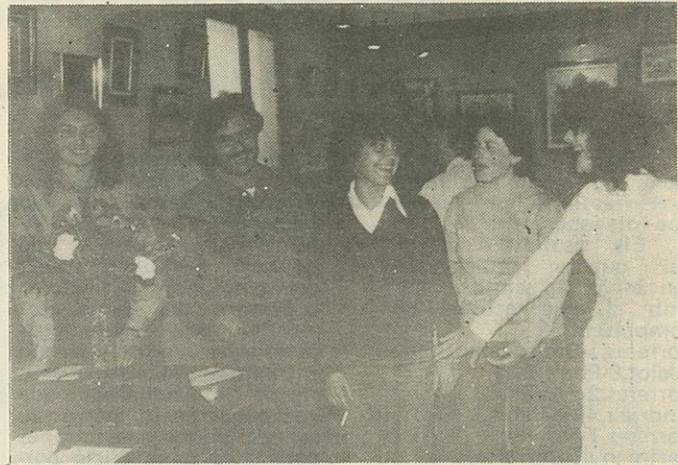
Membres de la Secció d'Arts Plàstiques que exposaren a "la caixa" (foto Joan B. Bauçà).

res del tema —que ja tractarem en un reportatge el passat mes de setembre— pensam oferir un ample resum i conseqüent anàlisi d'aquesta reunió en un proper número.