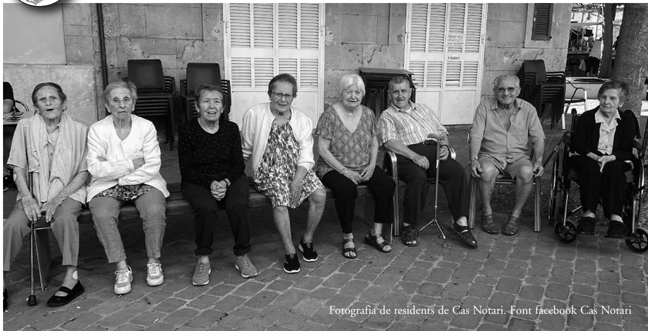
Fotografia de residents de Cas Notari.