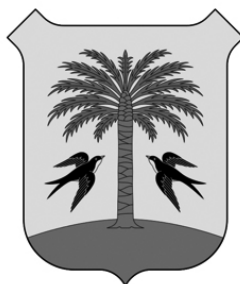
3. Escut de la Viquipèdia (2019)

Des de fa uns anys ençà, s'estan usant dos escuts de Porreres diferents de forma oficial i es crea així una confusió evitable. 1 Aquesta confusió és entre l'escut que s'utilitzava des de principis dels anys 2000 2 i l'escut que Viquipèdia creà el 2019 per a il·lustrar la seva pàgina sobre el nostre poble. 3