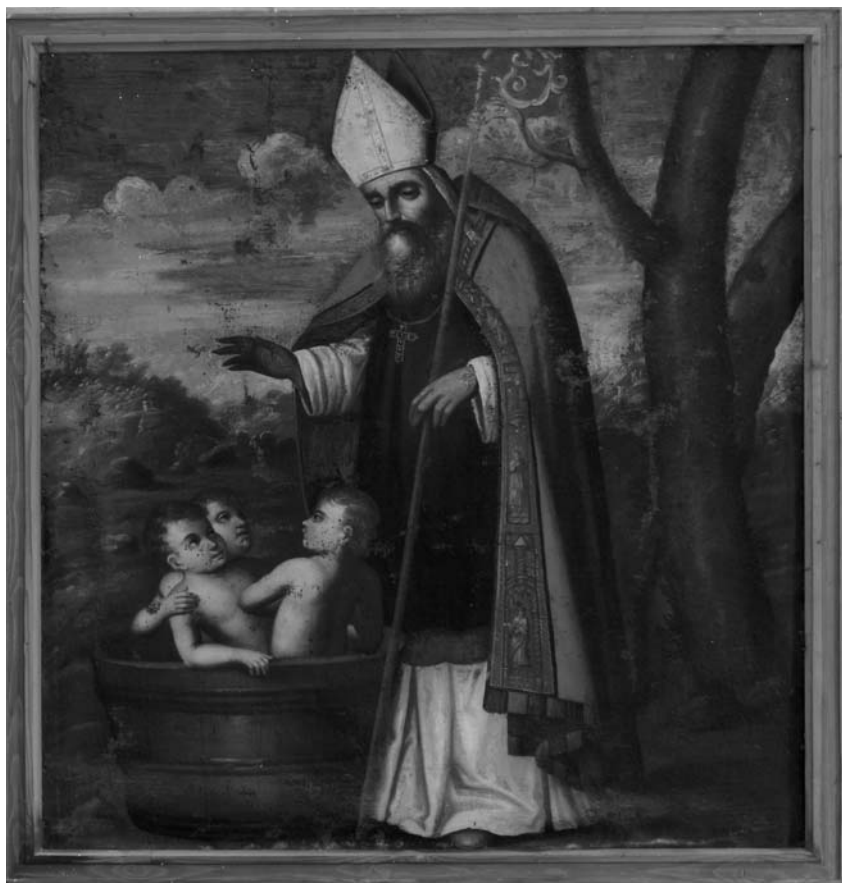
Sant Nicolau a la sagristia de Monti-sion, procedent de l'antic retaule major barroc.

Aquesta era una dita molt popular a Porreres que molts encara recordam. El seu origen prové d'una de les pintures de l'antic retaule major barroc que tengué Monti-sion i que ara es troba a la sagristia del mateix santuari. Es tracta de la pintura de sant Nicolau de Bari de principis de segle XVIII (datada de 1711). En ella es veu al sant representat amb la seva iconografia habitual: revestit de bisbe i als peus tres infants que surten de dins una bota. Aquesta representació ha donat lloc a la indumentària de santa