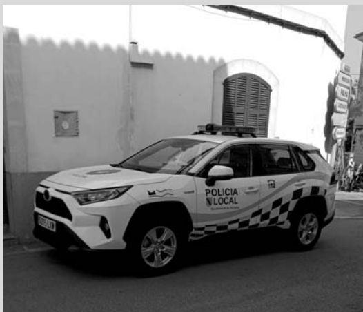
7. La Policia Local no és la primera que hauria de donar exemple?