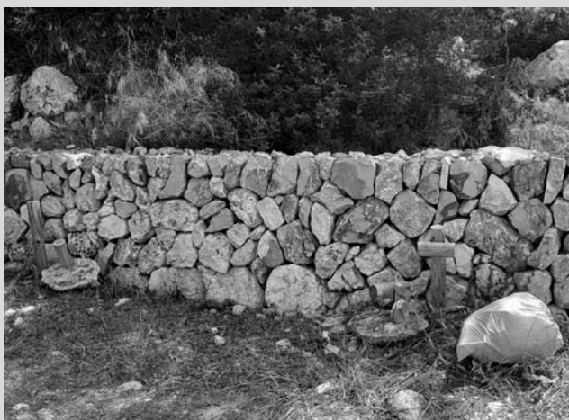
8. Els elements del voltant del Pou Celat necessiten mà de metge.