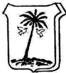
1. Segona meitat del segle XX