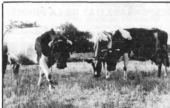
La rendabilitat en l'elaboració del formatge i altre derivats de la llet, sortida de futur?

DE LA PALLA: Degut a la poca aigua caiguda n'hi haurà