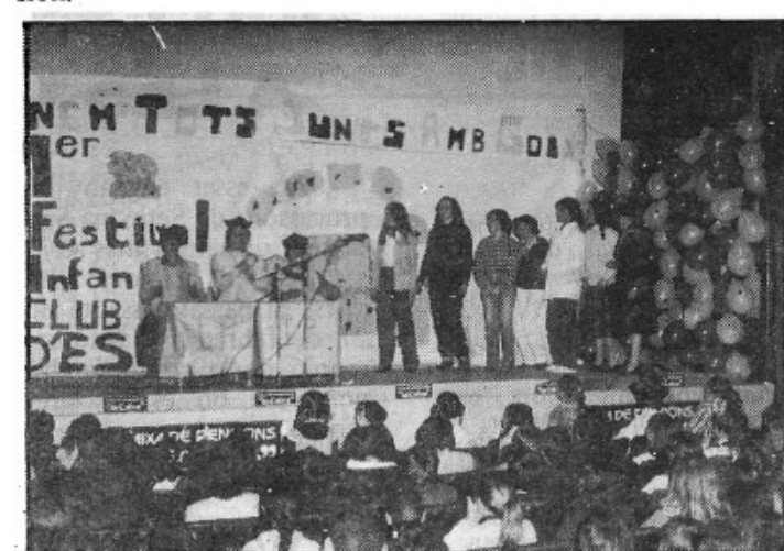
"No ens conformam amb entretenir i divertir als al.lots". 1er. Festival Infantil Foto Vidal

Una excursió al Puig de Santa Magdalena.