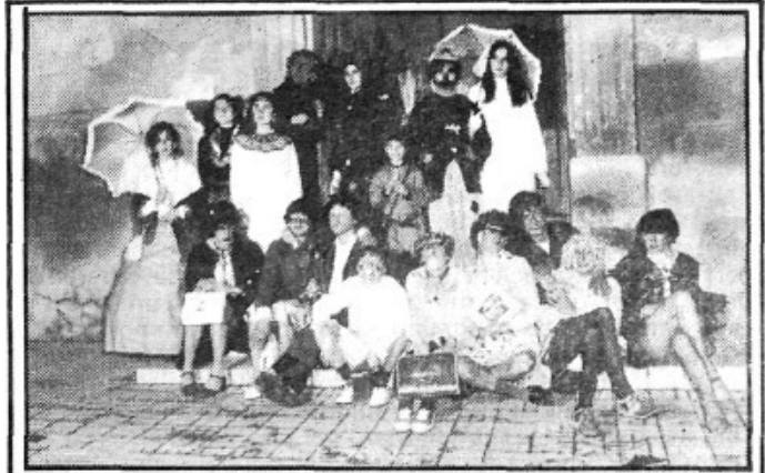
Cada any augmenten les disfresses i les festes per Carnestoltes. El públic demana sarau...

La premsa mallorquina té un paper en aquesta tasca comuna i si per negligència, convalida o mala fe l'abandona, contraurà una greu responsabilitat davant el poble, que, si és cert que la veritat sempre sura, a la llarga, la hi haurà d'exigir.